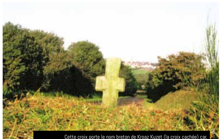
Cette croix porte le nom breton de Kroaz Kuzet (la croix cachée) car, à l'origine, elle était plantée au pied du talus et les herbes sauvages la couvraient.