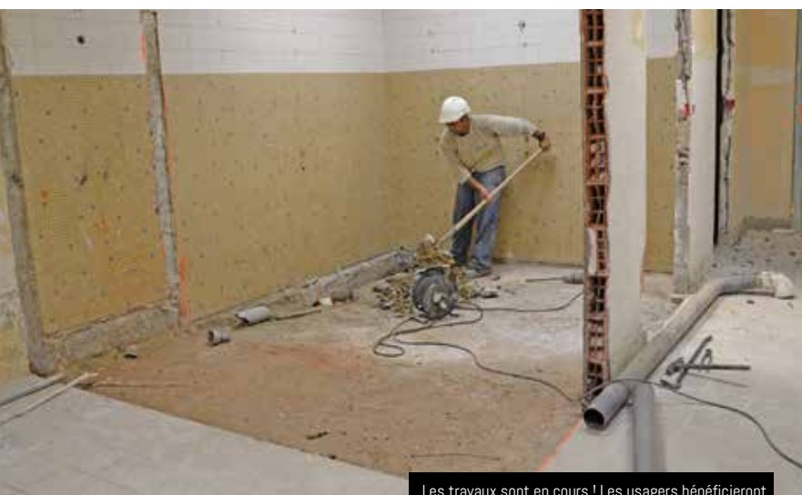
Les travaux sont en cours ! Les usagers bénéficieront de douches neuves, salle Jean Kergoat, à la rentrée

Pour Guipavas comme pour de nombreuses collectivités locales, la période estivale est chaque année propice à la réalisation de travaux de rénovation des équipements municipaux. Entretien, réfection, réaménagement, poursuite des chantiers d'envergure : l'été 2018 ne fera pas exception à la règle. De nombreux travaux dans les infrastructures scolaires et sportives sont à l'agenda des prochaines semaines.