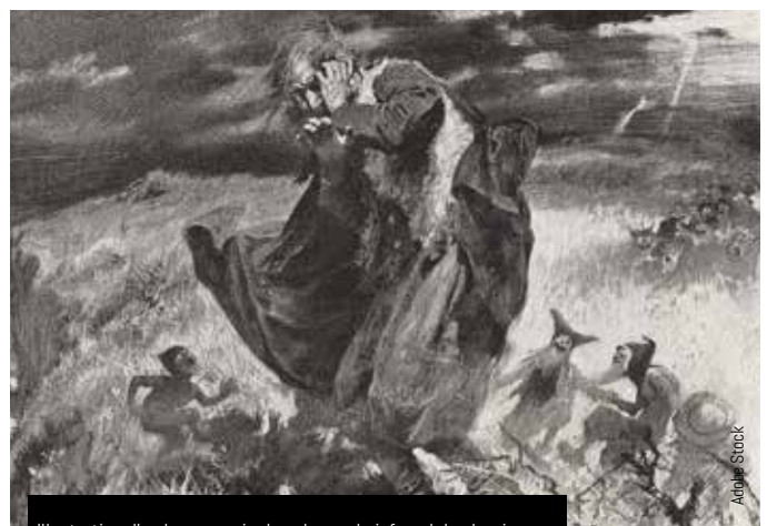
Illustration d'un homme pris dans le cercle infernal des korrigans

date de l'élargissement et du réaménagement du vieux chemin de traverse de Kerango autrefois très fréquenté par les paysans du Douvez pour se rendre au moulin et au bourg