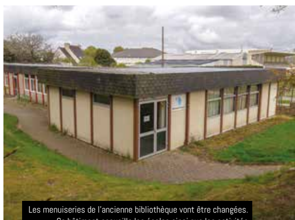
Les menuiseries de l'ancienne bibliothèque vont être changées. Ce bâtiment accueille les écoles ainsi que les activités (théâtre, danse, réunion, etc.) d'une douzaine d'associations